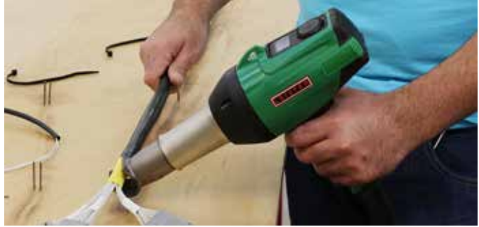
Ideal en la retracción de cables con el GHIBLI AW

aire podrán ajustarse fácilmente. La base de apoyo y el práctico soporte para colgar que incluye el producto le facilitarán el trabajo. Los filtros de aire se retiran y limpian con facilidad. Y, por supuesto, todas las boquillas de los anteriores modelos se ajustan a la GHIBLI AW.